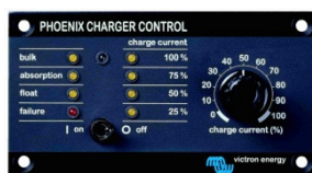
Tableau 'Phoenix Charger Control'

Alarme visuelle et sonore en cas de tension batterie trop haute ou trop basse. Seuils de déclenchement réglables. Contact sec pour signalisation déportée.