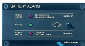
Tableau 'Battery Alarm'

Alarme visuelle et sonore en cas de tension batterie trop haute ou trop basse. Seuils de déclenchement réglables. Contact sec pour signalisation déportée.